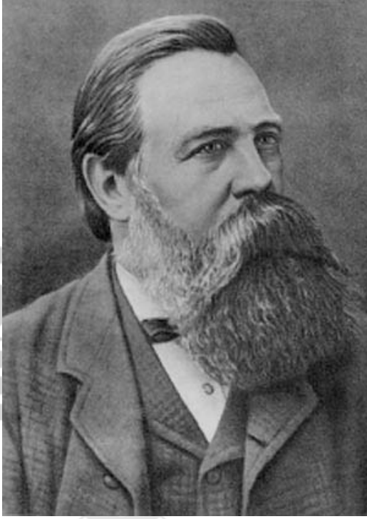
فريڊرڪ اينجلس (ڄم: 28 نومبر 1820ع - وفات 5 آگسٽ 1895ع)